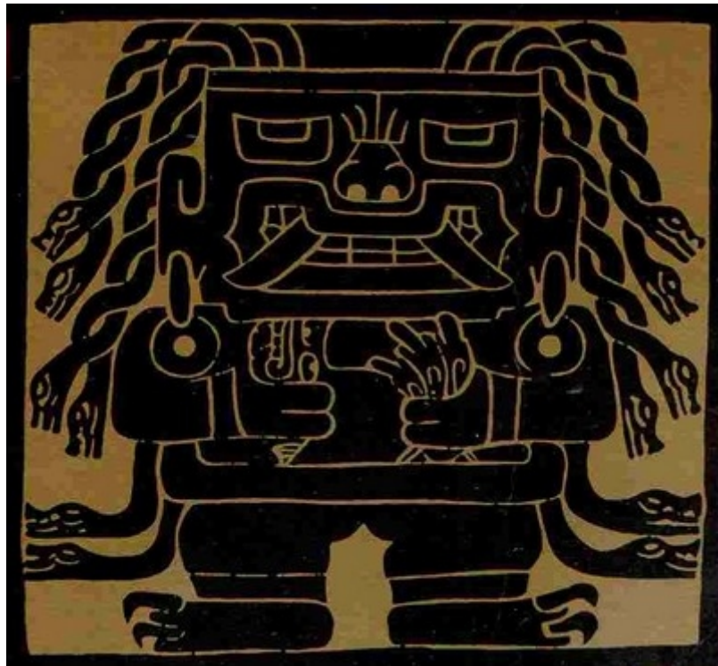
Le jaguar anthropomorphe, terrible divinité de Chavin, au Pérou 2000 ans avant les Incas.