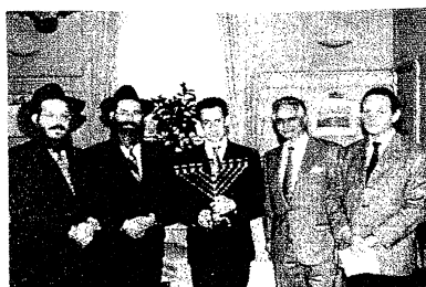
Fig. 3 - Nicolas Sarkozy tenant entre ses mains le chandelier à Neuf branches , symboles des Neuf lumières kabbalistes .

On y retrouve les mêmes origines et influences.