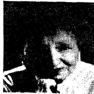
Fig 1 - Son grand-père maternel, rabbin célèbre pour son sionisme, créateur du premier journal sioniste El Avenir en 1898, un an avant le 1er Congrès sioniste de Bâle.