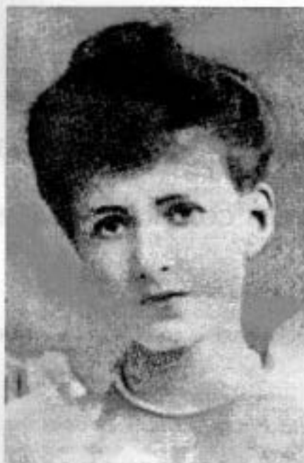
Nesta Webster photographiée à 22 ans