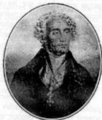
Giuseppe Balsamo alias Cagliostro (1743-1795) & Le comte J. de Maistre (1753-1821)