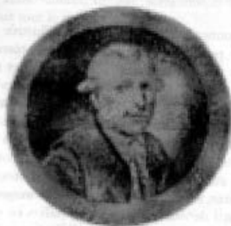
Adam Weishaupt 1748-1830

anglais, envoyés de Londres au temps de la Régence, pour y répandre ce véhicule destructeur, favorable aux intérêts de leur oligarchie.