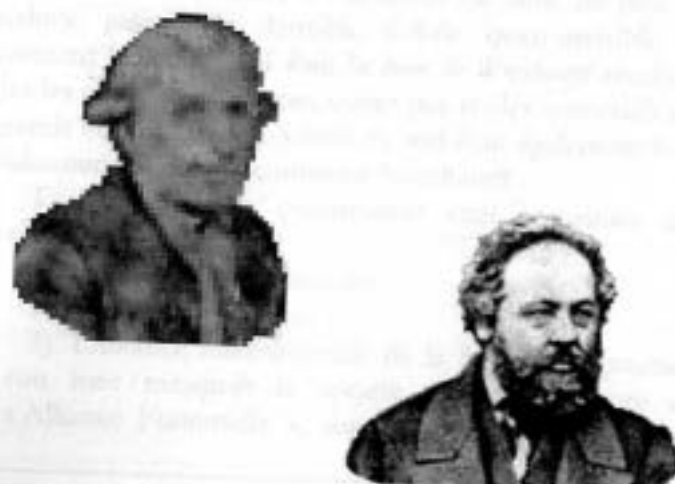
Adam Weishaupt (d'après un camé reproduit dans La Duchesse d'Ingolstadt (de Mme de Stael) et Bakounine