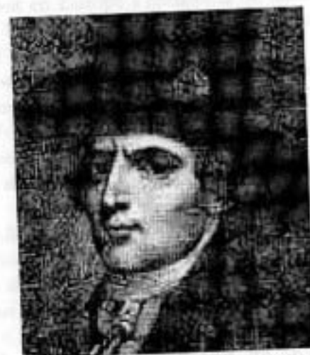
François-Noël Babeuf, dit Grachus (1765-1797), l'un des chefs des « Enragés ».

Fouché le faisait espionner par Bourienne son secrétaire. La Maçonnerie Illuministe , principal agent de Révolution, le restera par sa postérité que l'auteur expose aux chapitres suivants. Cette constance pluriséculaire dans les objectifs serait inconcevable s'il n'y avait eu derrière un facteur caché et durable très puissant, qui s'était associé le pouvoir politique d'Angleterre, de Hollande, de Prusse et de diverses principautés. Dorénavant l'influence déterminante de membres des élites aristocratiques, Intellectuelles, financières et bourgeoises dans toute l'Europe et aux États-Unis, liés en un système impérialiste anonyme international – mais au nom de Moloch et de Baäl – capable de se faire craindre et obéir et de récompenser, et utilisant les divers mouvements d'opinion comme d'un arsenal d'armes opportunes, comme ils en utiliseront bientôt d'autres, tous « Illuminés » et détournés ensuite selon la même méthode de mensonge.