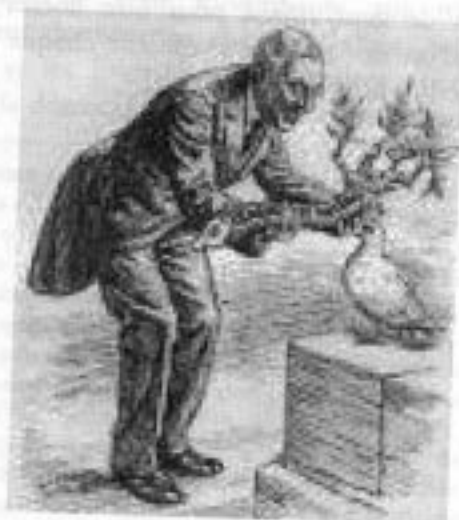
Woodrow Wilson à Versailles en 1918 reprenant les mêmes gestes que Th. Jefferson et Franklin en 1787,