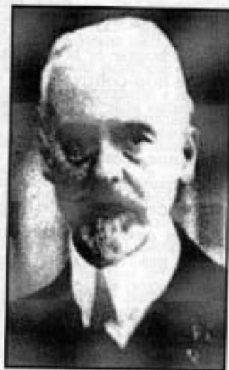
Wickman Steed (auteur de Hapsburg Monarchy )