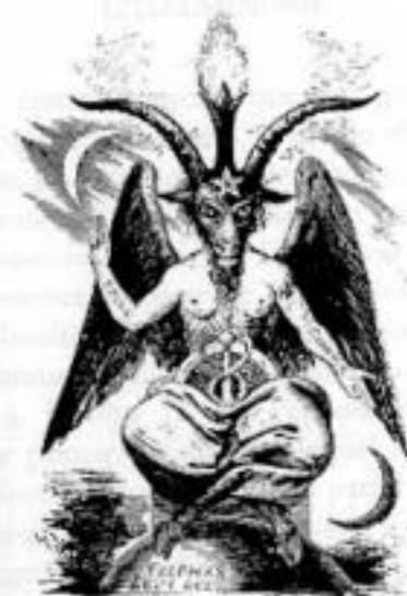
Le Baphomet d'Éliphas Lévy (Éliphas Lévy n'est autre que l'abbé Constant, prêtre défroqué).

modernes : l'esprit révolutionnaire 1 . »