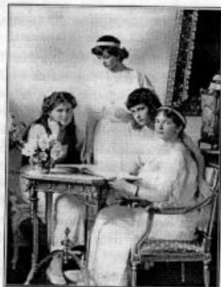
Les princesses Romanov en 1915, deux ans avant leur martyr.