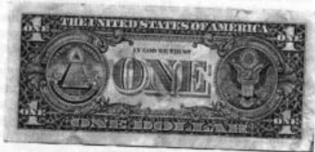
Verso du billet de un dollar avec l'emblème illuministe à gauche.

Le principe Chrétien, telle est la force qui peut seule s'opposer à la puissance satanique de la Révolution Mondiale .