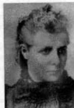
Helena-Petrovna Blavatsky (1831-1891) & Annie Besant (1847-1939)