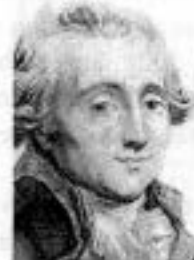
Robespierre, Saint-Just, Couthon (Comité de Salut Public).