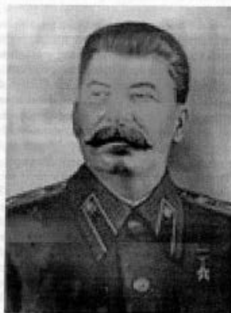
Staline (un mot d'esprit – discutable, certes – circulait dans les années 40 : « Un homme de fer (Stahl en allemand), les autres entaile »).