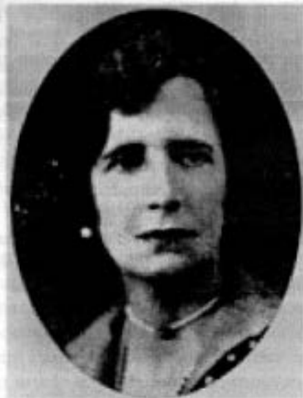
Nesta Webster dans les années 40