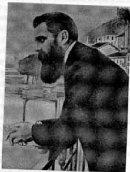
Théodore Herzl au Congrès de Bâle (1897)