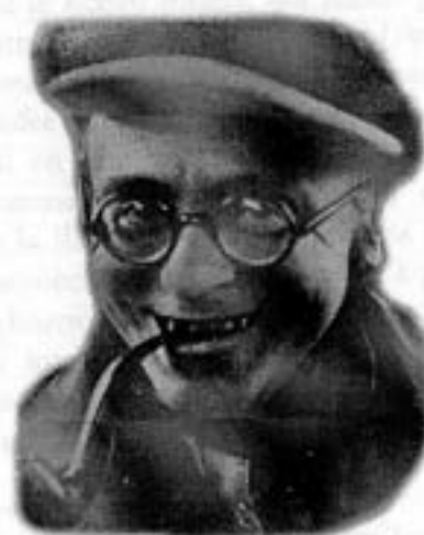
Karl Sobellson, alias Radek (1885-1939)

— Mais Il est non moins vrai que la haute Juiverie a su, par la Maçonnerie, associer à son projet un grand nombre de Goïms complices pour des avantages matériels momentanés.