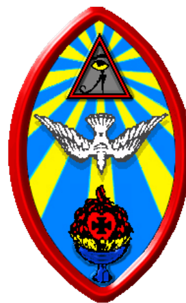
O. T. O. (Ordo Templi Orientis)

Mariano Rampolla del Tindaro, né à Polizzi Generosa, en Sicile, le 17 août 1843 et mort à Rome le 16 décembre 1913, était un cardinal italien, cardinal secrétaire d'État de Léon XIII.