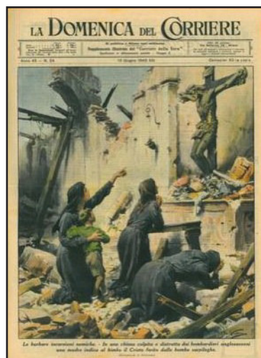
Illustration de couverture La Domenica del Corriere Christ intact malgré les bombes

Ceux qui trouvent sans chercher, sont ceux qui ont longtemps cherché sans trouver. Un serviteur inutile, parmi les autres.