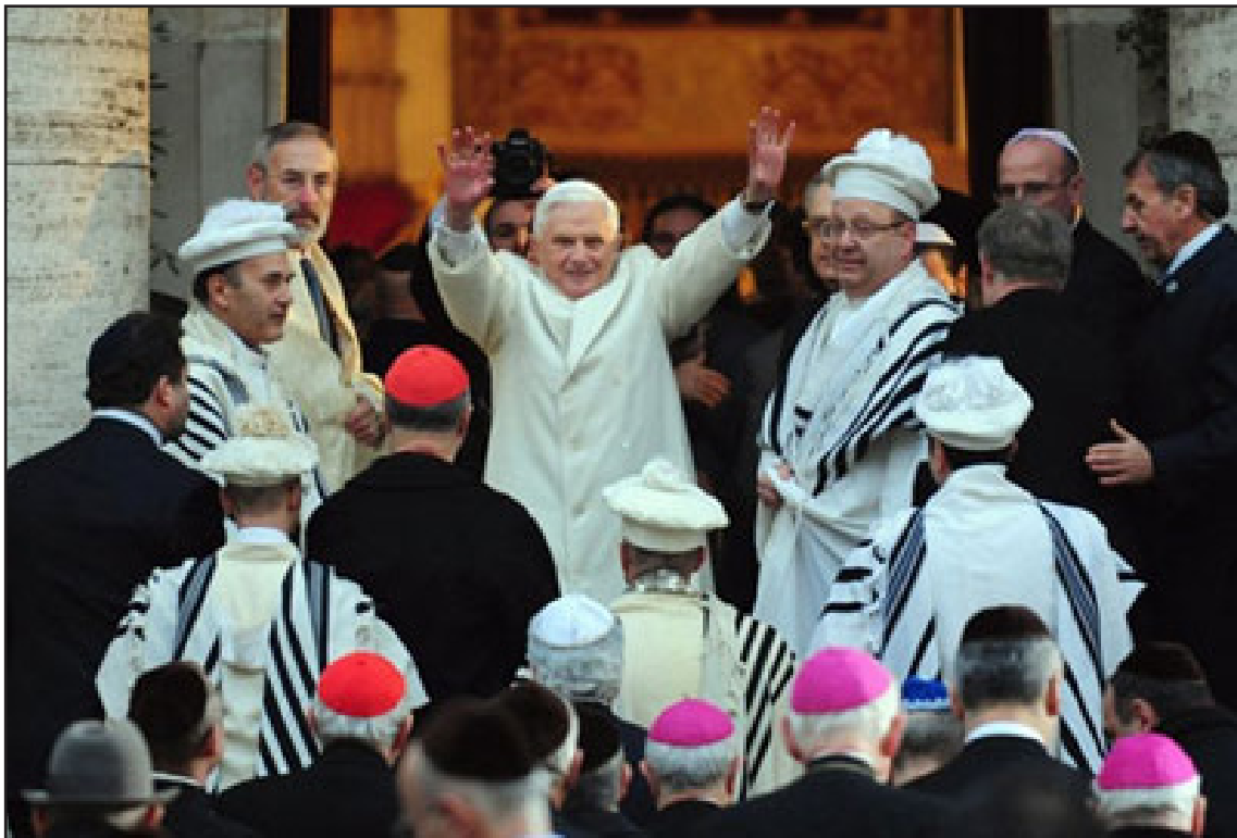
Ratzinger-Benoît XVI avant de pénétrer dans la synagogue de Rome, accueilli par l'actuel grand rabbin de Rome, Riccardo Di Segni.

Ratzinger-Benoît XVI vient de visiter une nouvelle synagogue, celle de Rome, le dimanche 17 janvier 2010, renouvelant ainsi la visite "historique" de son prédécesseur, Wojtyła-Jean-Paul II, dans cette même synagogue, le 13 avril 1986.