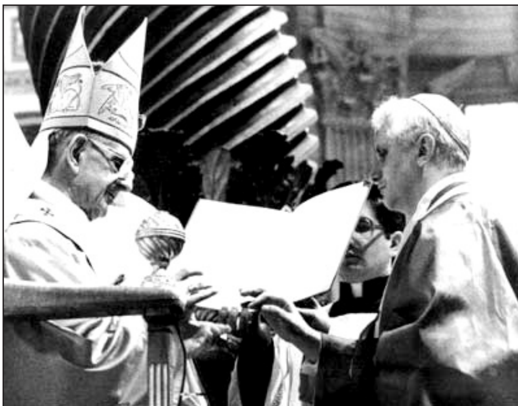
Montini avec Ratzinger qui joua un rôle important lors du Conciabule Vatican II